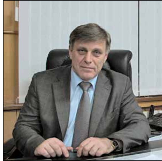
Т.И. Ибрагимов, министр здравоохранения Республики Дагестан